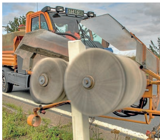
Ein Beitrag für mehr Sicherheit auf den Straßen ist die regelmäßige Reinigung der Leitpfosten mit einem Spezialvorsatz (unten) oder die Reinigung der Rad- und Fußwege mit der kleinen Kehrmaschine (oben).

Lampen werden jedes Jahr zuerst zerkleinert. Dann werden Glasbruch und Metallteile vom quecksilberhaltigen Leuchtstoff getrennt. Im folgenden thermischen Trennungsprozess wird der Leuchtstoff ausgeheizt und so vom Quecksilber befreit. Glas und Metallteile werden der Wiederverwertung zugeführt. In einer weiteren Anlage werden Bildschirme zerlegt und deren Teile wiederverwertet.